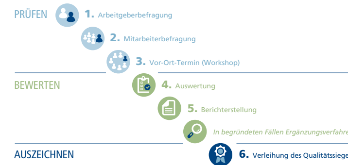
Abbildung: Ablauf des Prüfverfahrens

dauert zwischen ein paar Wochen und vier Monaten. In dieser Zeit kann der Geschäftsbetrieb ungestört weitergehen.